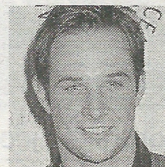
RYAN MERRIMAN (29 años) Actor