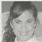
TONI ACOSTA (40 años) Actriz